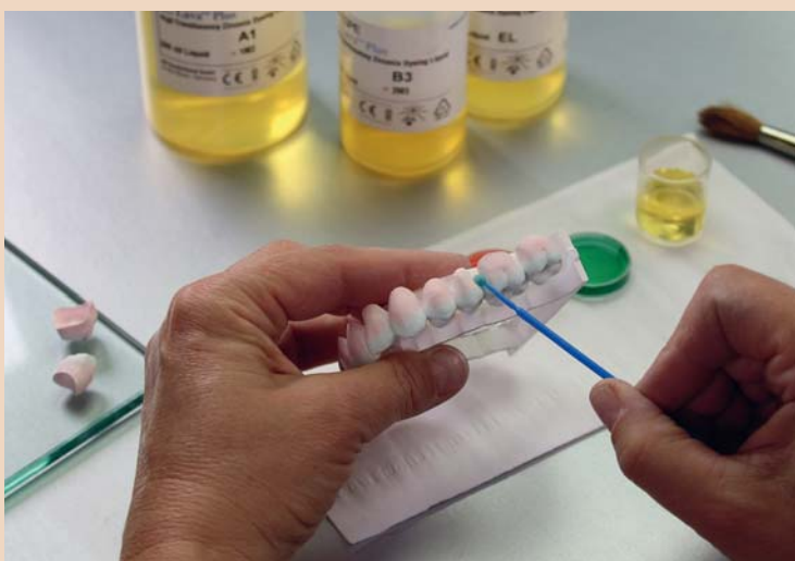
Anwendung der Lava Plus Färbeflüssigkeiten von 3M an einer monolithischen Versorgung aus Lava Plus Zirkonioxid.

3M hat in der Zahntechnik zahlreiche Lizenzen für seine Patente erteilt, darunter an die Firmen VITA Zahnfabrik H. Rauter GmbH &