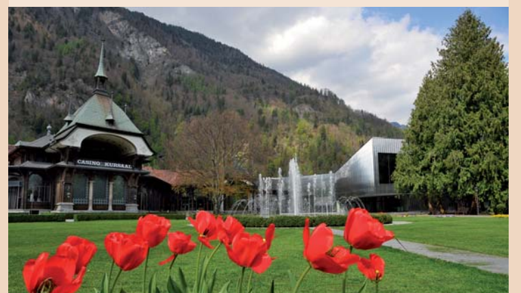
Nach 2008 tagten die Swiss Dental Hygienists wieder im Kursaal Interlaken.