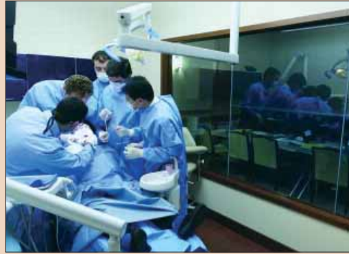
Live Dentistry Theatre : GNYDM.

: 2008 Greater New York Dental Meeting “Live Dentistry Arena”