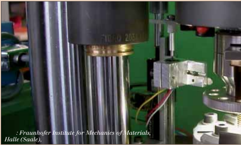
: Fraunhofer Institute for Mechanics of Materials, Halle (Saale).

Fraunhofer Institute for Mechanics of Materials