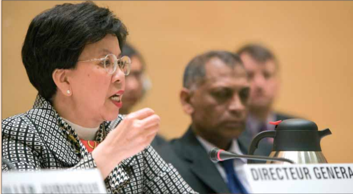
Dr Margaret Chan WHO (World Health Assembly)

WHO Margaret Chan WHO Graduate Institute WHO Chan Institute 가