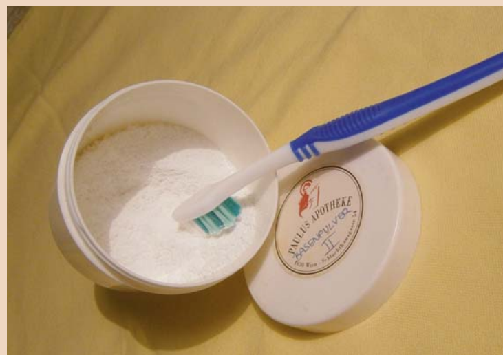
Putzen mit Soda.