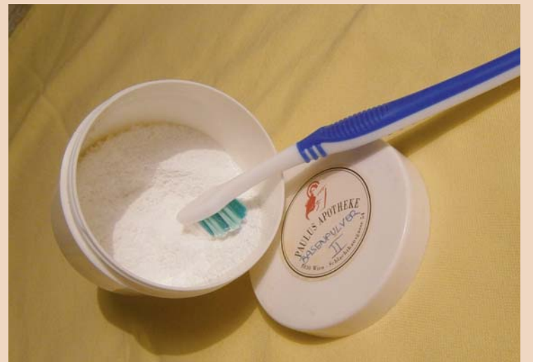
Putzen mit Soda.