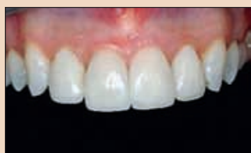
Фиг. 2а и 2б. Завършените и фиксирани фасети с изглед от фащиално и палатинално след две години.