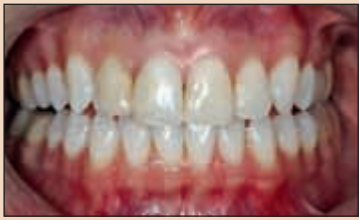
Фиг. 1б. Зъбите са избелени. Забележете разликата в цвета между избелените зъбни тъкани на резците и наличните композитни възстановявания.