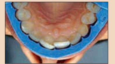
Фиг. 14. При такива ситуации се прави предварително естетично реконтуриране (ПЕР). Протрудираните повърхности на зъбите, разположени по-вестибуларно спрямо определените финални контури на окончателните полифасетни възстановявания се изпилват, така че силиконовият индикатор да се поставя пасивно върху зъбната дъга. Забележете изпиления медиоинцизален ъгъл на зъб 11 и пасивната позиция на СИ върху зъбната дъга след ЕПР. За да се оцени крайният резултат от предложения нов дизайн на усмивката, трябва да се изпробват временните конструиращи за предварително оценяване на естетиката (ВКПОЕ).