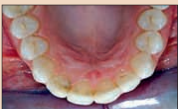
Фиг. 1в. Големи композитни обтуриации и кавитация от палатинално.