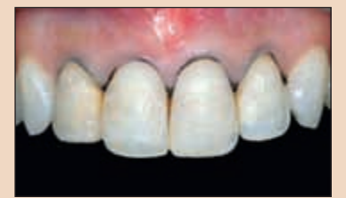
Фиг. 3. В гингивалните сулкуси са поставени ретракционни конци за предпазване на меките тъкани от евентуални увреждания по време на зъбната препазация и за по-добро вземане на отпечатъка. Първо се използват борери за задаване на препазиращата дълбочина.

Когато обмисля лечебните варианти за постигането на нова усмивка, зъболекарят предприема създаването на нов, естествен естетичен ефект. При всяко възстановяване следва да гледаме на пациента в общ план, а не да се фокусираме само върху един или два зъба. Всеки зъб представлява част от усмивката на пациента и лицето, като има своята роля в създаването на усмивката, отразяваща личността на пациента.