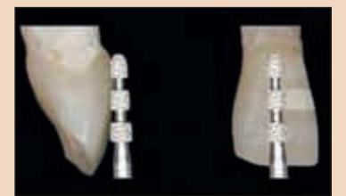
Илюстрация. Стандартно зъбно препазиране.