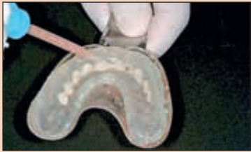
Фиг. 15а и 15б. Отпечатъкът, взет от восъчния моделаж, се напълва с течен композит (или друг материал по избор) и се поставя върху не-препарирани зъби.