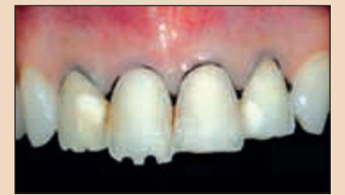
Фиг. 4а. Последни се редуцират инцизалните ръбове. Първо се задава необходимата дълбочина с цилиндрично борче по избор чрез създаването на няколко улея, които в последствие се свързват едни с други.