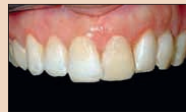
Фиг. 10. След пародонталната хирургия се прави нов провизорен модел от композитни наслявания, за да се определят по-добре новите пропорции и съотношения между зъбите.