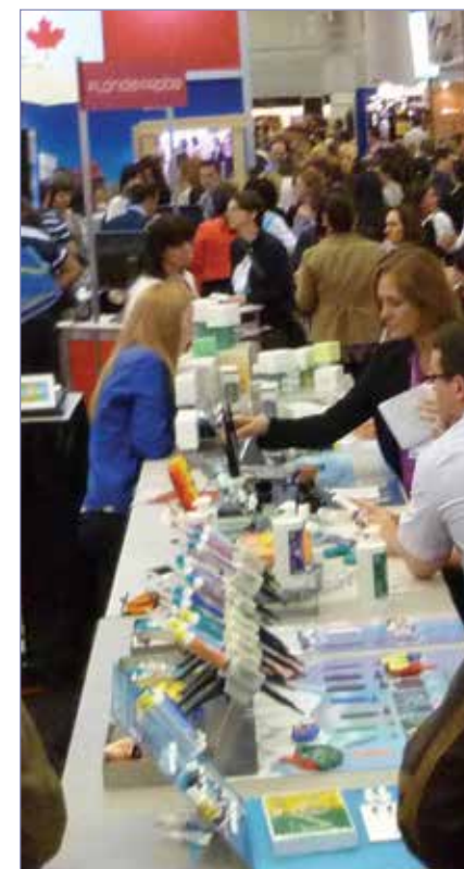
• Le hall d'exposition est ouvert aujourd'hui de 8 h à 18 h et demain de 8 h à 17 h. • The exhibit hall is open today from 8 a.m. to 6 p.m. and tomorrow from 8 a.m. to 5 p.m.