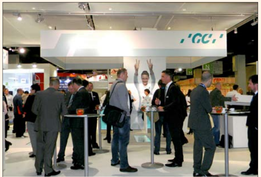
El stand de la compañía japonesa GC.