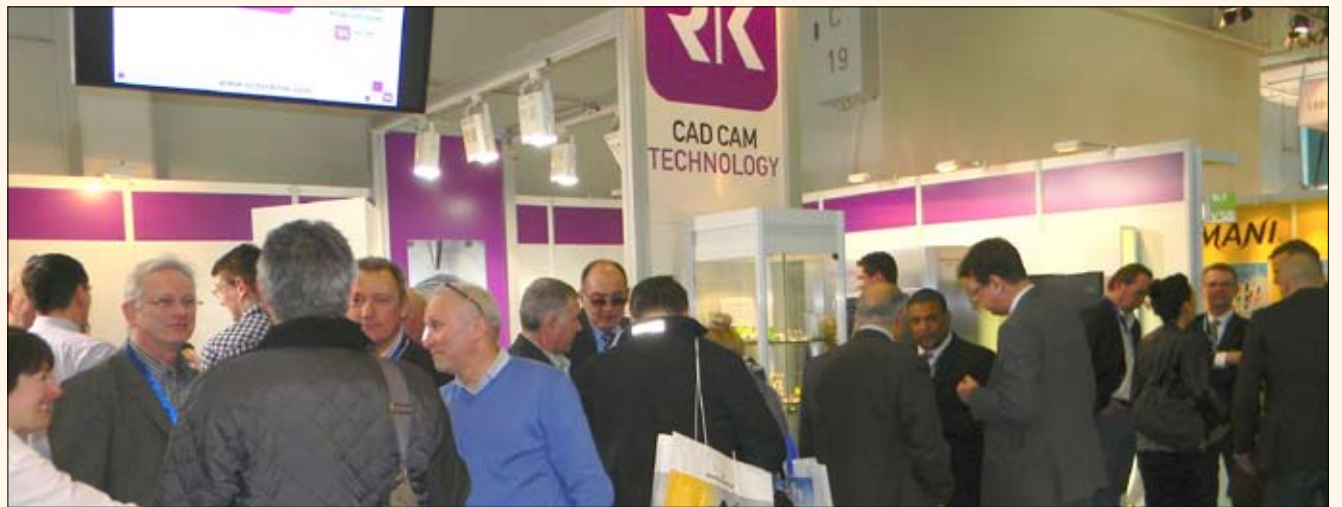
Los productos de la compañía alemana RK provocaron gran interés en Colonia.