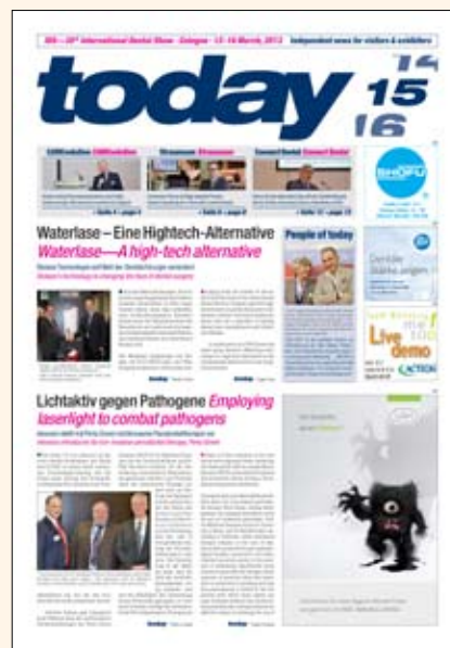
Portada de una de las ocho ediciones del periódico de ferias Today publicado en la IDS por DTI.

Uno de los grandes atractivos de la feria fue como siempre el “Media