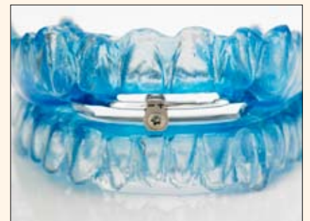
El dispositivo de avance mandibular que evita el ronquido y la apnea del sueño.

“Actualmente, es inevitable tratar el mundo dental desde una perspectiva