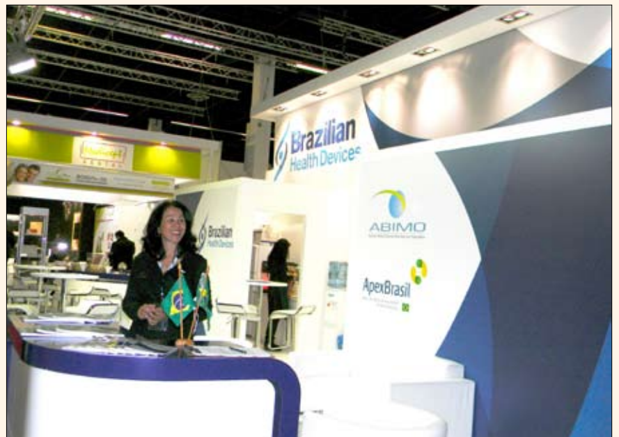
El área de recepción de ABIMO, la asociación de la industria médica y dental de Brasil.