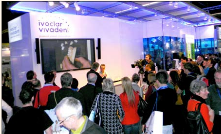
Una demostración en el stand de Ivoclar.