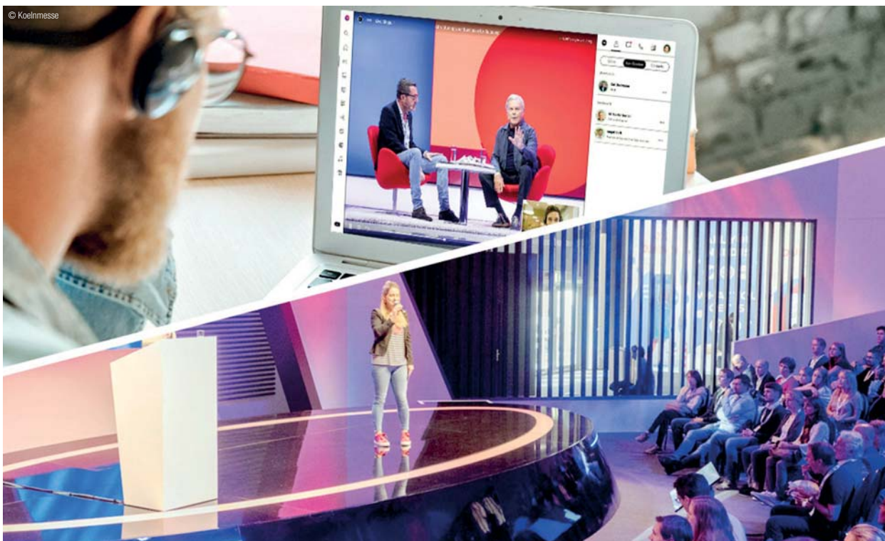
Neue Formate der Koelnmesse: Hybride Veranstaltungen vor Ort und im Netz.

Die größte Innovation im Sinne eines positiven Wandels liegt in einem neuen Miteinander, so wie ich es bereits beim Europäischen Pressegespräch im Vorfeld der IDS gespürt habe: Wir kommen wieder zusammen, wir sprechen miteinander, suchen aktiv den Wettbewerb um das beste Angebot und die attraktivste Messeneuheit. Ich bin selbst gespannt, was davon Zahnärzte und Zahntechniker am begierigsten aufnehmen. Dafür wünsche ich uns allen vom 22. bis zum 25. September 2021 eine spannende IDS in Köln. ◀