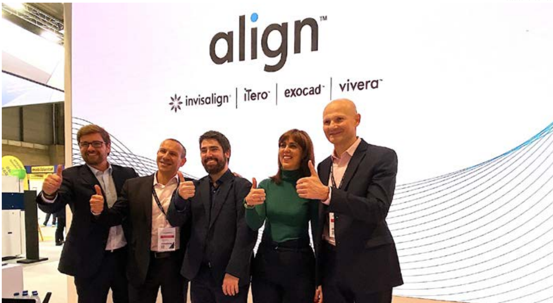
El equipo de Align Technology que presentó las nuevas tecnologías en EXPODENTAL Madrid 2024.