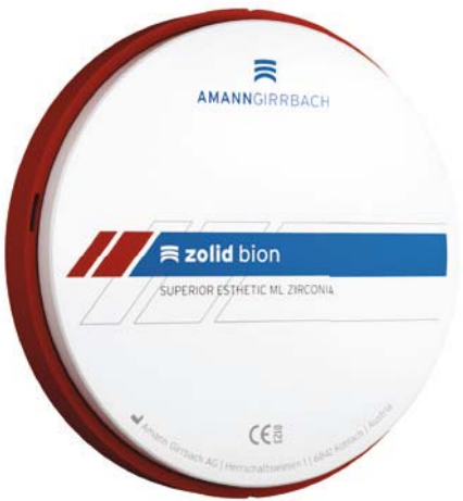
- Zolid Bion.