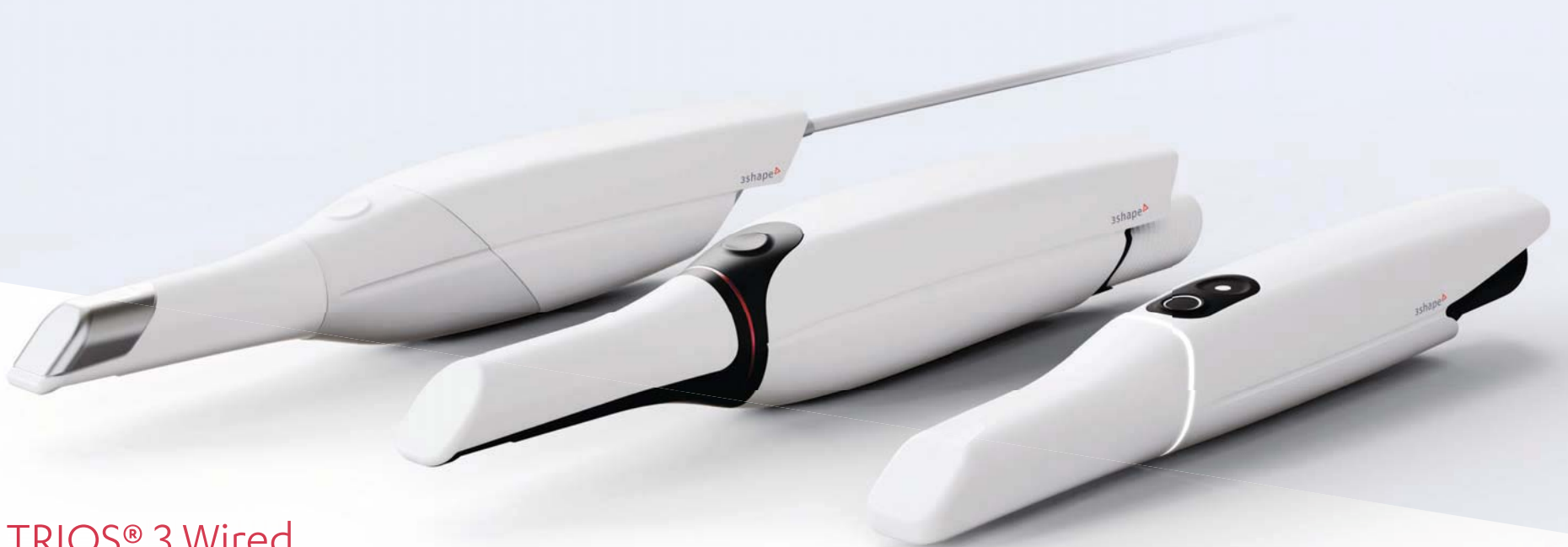
TRIOS® 3 Wired