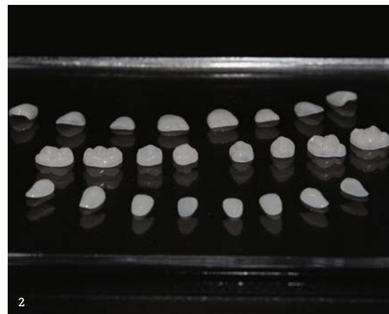
1 The new edelweiss i-BLOCK. 2 The edelweiss DIRECT VENEERS and OCCLUSIONVD system.