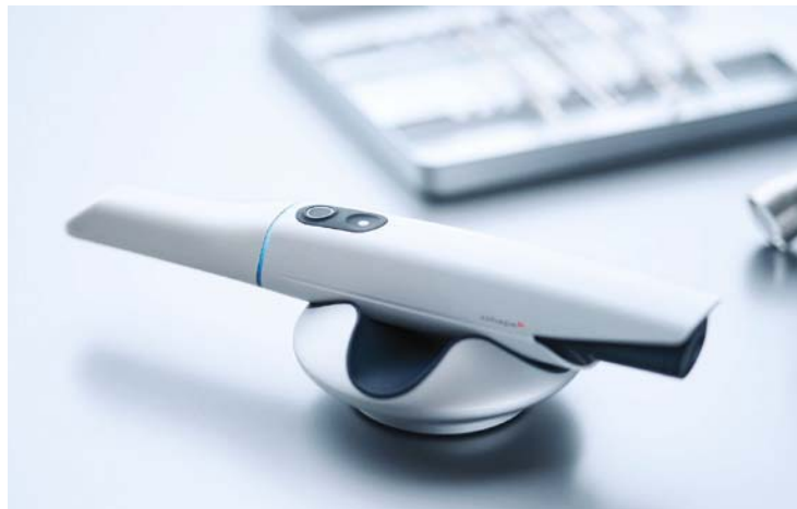
«1-3Shape TRIOS 5.

„Jede 3Shape-Lösung ist das Ergebnis unserer Zusammenarbeit mit Zahn- und Labortechnikern. Der 3Shape F8-Scanner zum Beispiel war sechs Jahre in der Entwicklung. Der Input kam nicht nur von unseren Designern und Ingenieuren, sondern auch von den Labortechnikern selbst. 3Shape hat Hunderte von Labormitarbeitern auf der ganzen Welt befragt, um ge-