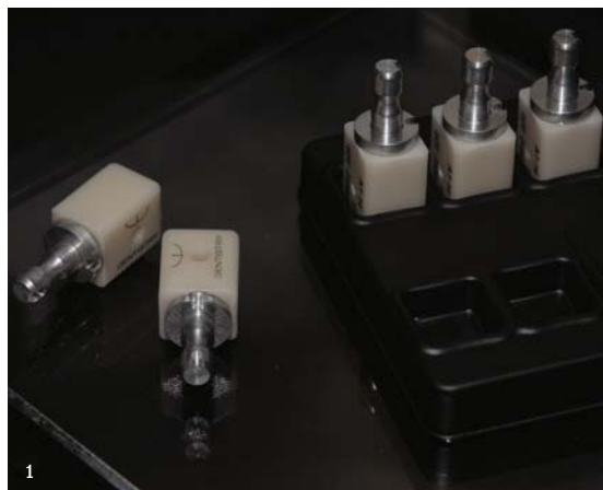
1 Der neue edelweiss i-BLOCK. 2 Das DIRECT VENEERS und OCCLUSIONVD-System von edelweiss.

Editorial note: Visitors to IDS 2023 can find more information on the edelweiss dentistry products at the company's booth (#D040/E041) in Hall 11.3. ◀◀