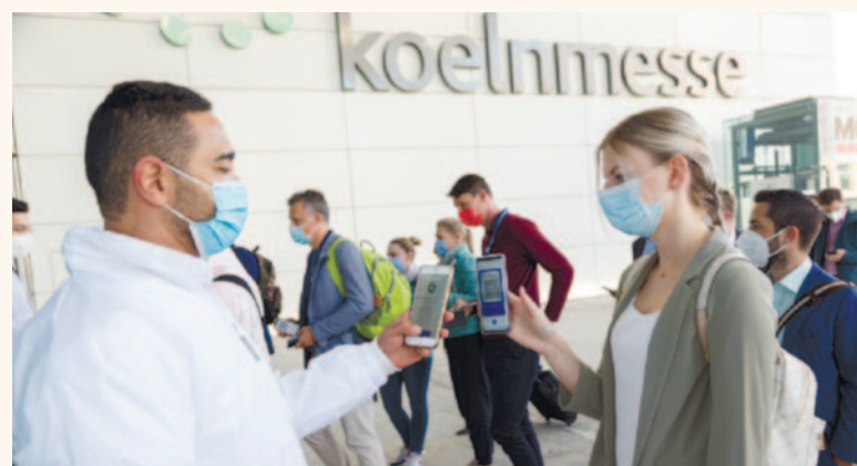
Организаторы IDS-2023 говорят, что выставка будет носить гибридный характер, и надеются, что она пройдет в «нормальных» условиях, т.е. с соблюдением тех же мер гигиенического и инфекционного контроля, которые были приняты на IDS 2021 г.

Выставка IDS 2023 г. будет развернута в семи залах общей площадью 180 000 кв. м. Таким образом, по своему масштабу она превзойдет предыдущие мероприятия; в 2019 г. 2260 экспонентов 38-й выставки, приехавших более чем из 60 стран, разместились на пло-