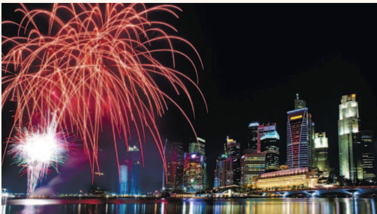
Только что из печати! На выставке IDEM медиахолдинг Dental Tribune International и его недавний сингапурский партнер Fireworks Business Information представили новое издание – DT ASEAN. (Иллюстрация: Daxiao Productions/Shutterstock)