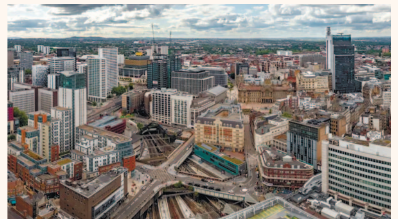
В этом году BOS проходила с 15 по 17 сентября в бирмингемском Международном конференц-центре; мероприятие следующего года состоится 28–30 сентября в Лондоне.