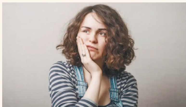
Проведенное недавно исследование показало, что сахарный диабет является единственным (из включенных в анализ) системным хроническим заболеванием, непосредственно связанным со стоматологическим здоровьем, и что диабет и хронические заболевания полости рта усиливают друг друга и затрудняют их лечение.