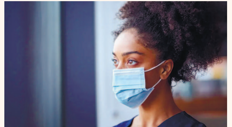
Согласно исследованию, проведенному по заказу Всемирного саммита инноваций в области охраны здоровья, недостаток подготовки, плохое финансирование и дефицит обученных кадров могут создать риск коллапса систем здравоохранения в случае новой пандемии.

«Пандемия COVID вынудила системы здравоохранения предпринять экстренные шаги — нарастить мощности, усилить инфекционный контроль, перейти к дистанционной помощи и массовой вакцинации. Сегодня необходимо оце-