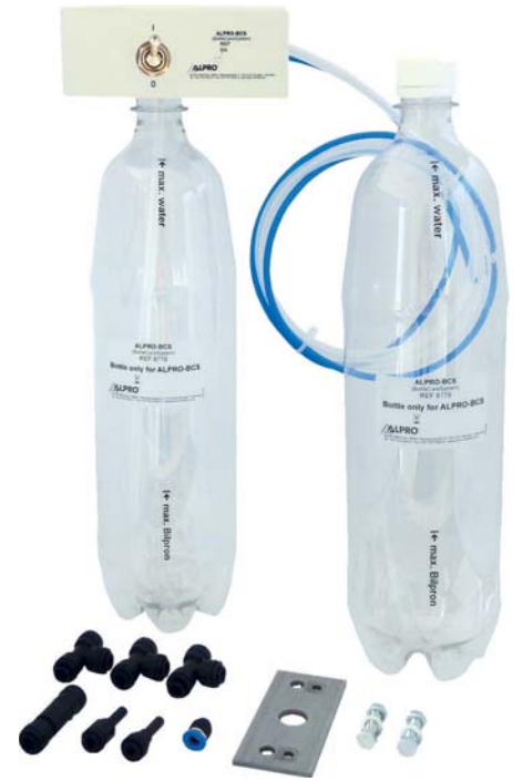
*Kit BCS disponible auprès du technicien.

3 e étape : réaliser une seule fois un choquage par un technicien habilité. Cette étape est recommandée lorsque vous changez de fauteuil ou si l'analyse bactériologique révèle la pré-