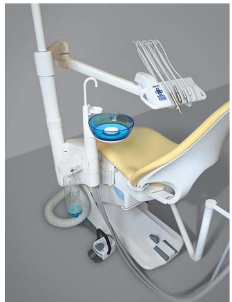
*Réservoir installé sur l'unité.

4 e étape : Utilisation d'un réservoir d'alimentation du fauteuil (à remplacer tous les huit mois) qui servira à employer une solution diluée avec l'eau filtrée destinée aux soins.