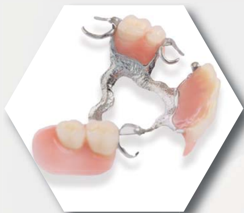
Stellite ® 139€