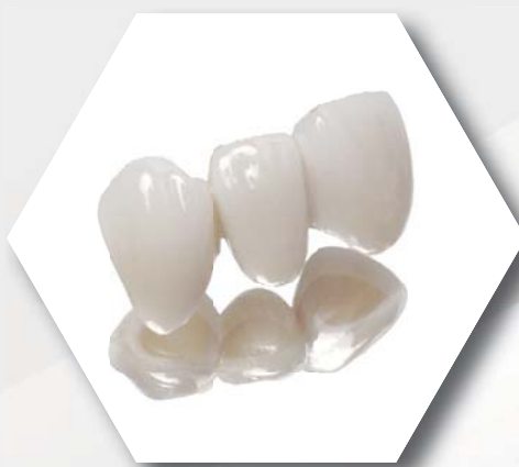
Céramique sur zirconium 124€