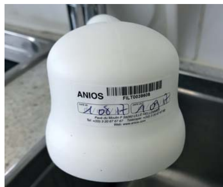
*Filtre sur le robinet avec la date, à changer tous les mois.

2 e étape : Mise en place d'un filtre « tous germes » de 0,22 µm sur le robinet qui servira à alimenter le réservoir, mais aussi à réaliser tous les traitements d'autres dispositifs, comme le