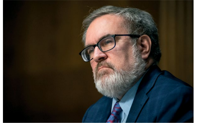
Andrew R. Wheeler recherchait activement des alternatives scientifiquement prouvées à l'expérimentation animale dans son rôle d'administrateur de l'Agence américaine de protection de l'environnement.

Même si certaines études doivent utiliser des modèles animaux pour mieux comprendre les mécanismes des maladies humaines et pour trouver des options de traitement appropriées, dans de nombreux domaines, comme l'endodontie, il convient d'examiner attentivement si les études sur les animaux sont appropriées et si les réponses apportées par la recherche, peuvent être fournies d'une autre manière. Les études animales sont toujours considérées comme essentielles pour comprendre certaines questions susceptibles d'améliorer la santé humaine. Toutefois, le centre néerlandais Systematic Review Center for Laboratory animal Experimentation a souligné que la majorité des premiers essais cliniques de nouveaux médicaments échouent,