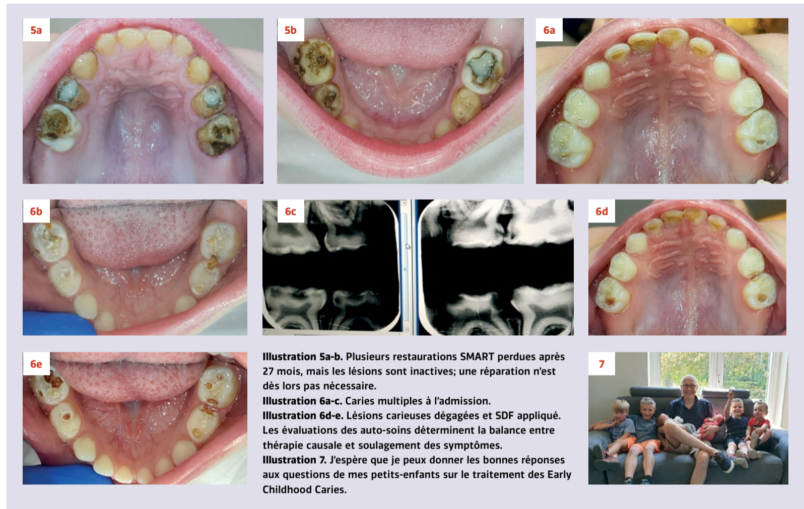
Illustration 5a-b. Plusieurs restaurations SMART perdues après 27 mois, mais les lésions sont inactives; une réparation n'est dès lors pas nécessaire.

C'est une bonne chose qu'aux Pays-Bas, la nouvelle directive Mondzorg voor Jeugdigen preventie en behandeling van cariës (NDLR