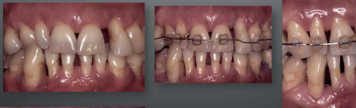
Grefe épithélio-conjonctive – Renfort - Fonctionnelle