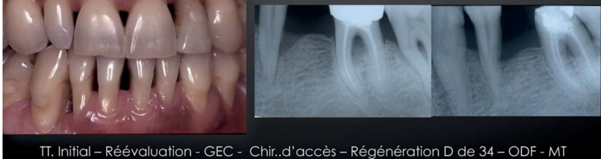
TT. Initial – Réévaluation - GEC - Chir..d'accès – Régénération D de 34 – ODF - MT

*Cas clinique : patient présentant une parodontite chronique, sévère. Le traitement parodontal a stabilisé la phase infectieuse, préparé et renforcé le parodonte superficiel et profond. L'orthodontie a amélioré le remaniement osseux, pérennisé les résultats cliniques et apporté une satisfaction esthétique. (Courtesy Dr Galletti Catherine).