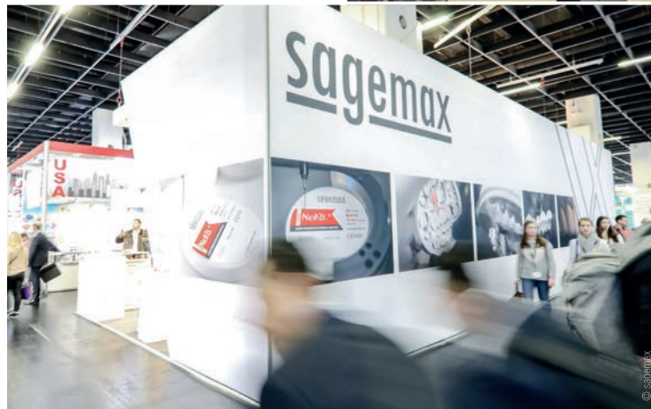
^ Der Stand des Unternehmens auf der IDS 2019. * The company's booth at IDS 2019.

Our new slogan is “Enjoy. Product. Experience.” and that is precisely what we would like to realise this week. We want to demonstrate our approachability. Everybody is welcome to discover our products over a cup of coffee and come discuss in detail the many restorations we are showcasing here. ◀