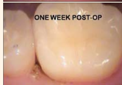
Figuras 2-6. La odontología restauradora es muy fácil con estos láseres, ya que permiten eliminar el tejido gingival de un diente y simultáneamente conseguir hemostasia.