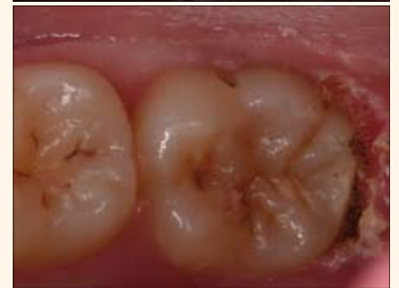
Figuras 9-11. El láser de diodo es ideal para el tratamiento de tejidos hiperplásicos, que aumentan el riesgo de caries y de enfermedad periodontal.