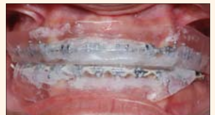
Férulas blandas instaladas en ambos maxilares; nótese el peróxido de hidrógeno sobre dientes y brackets.