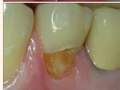
Figuras 7-8. Remoción del exceso de tejido gingival con el "ezlase" de Biolase Technology para mejorar el acceso a la restauración en la preparación de Clase V.