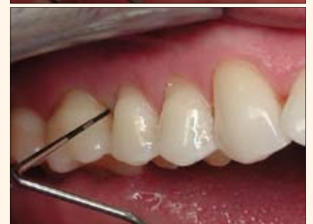
Figuras 13-14. El uso del láser de diodo (Picasso) junto con raspado y alisado radicular acelera la curación gingival y la comodidad en el post-operatorio.