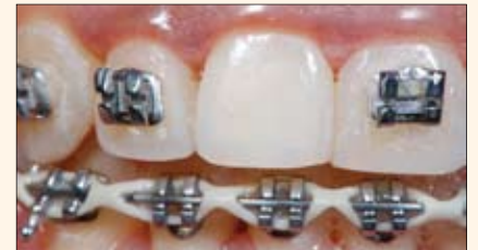
Una vez se retiran los residuos de resina, la zona donde estaba el bracket se observa totalmente aclarada y de color uniforme.