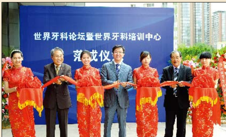
世界牙科论坛暨世界牙科培训中心落成仪式举行。

在过去的几年里, 这些指导方针一直引起进口商和医生的不安。他们责怪这些规定使医学和牙科专家不能使用最先进的设备并谴责医疗成本越来越高。DT