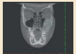
图2: CBCT扫描显示左侧上颌窦明显不对称。

牙弓异常的精确位置，解释此处为何会造成未来的治疗困难，以及我们需要采取的补救措施。例如，如果我必须向患者介绍外科医生进行口腔手术，比如必须拔除阻生的尖牙，我可以向患者演示扫描图像并解释说明。