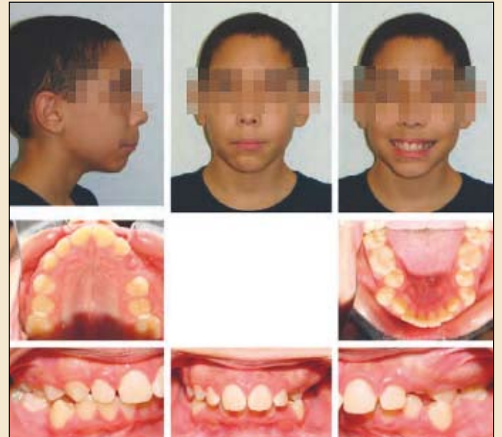
图1: 12岁男性，注意伴随牙齿萌出的左上牙龈肿胀。

扫描时除了得到所需的诊断信息，也替代了诊断开始前所需的牙颌模型。这的确是一大提升，因为许多病人真的不喜欢取模时的恶心和不适。我也获得了咬合的解剖透视图。有关牙齿位置，阻生的尖牙和第三磨牙，替牙期，及其他牙列异常的问题可迅速得到答案，这在2D X线设备是不可能的。CBCT扫描帮助孩子和家长更容易理解