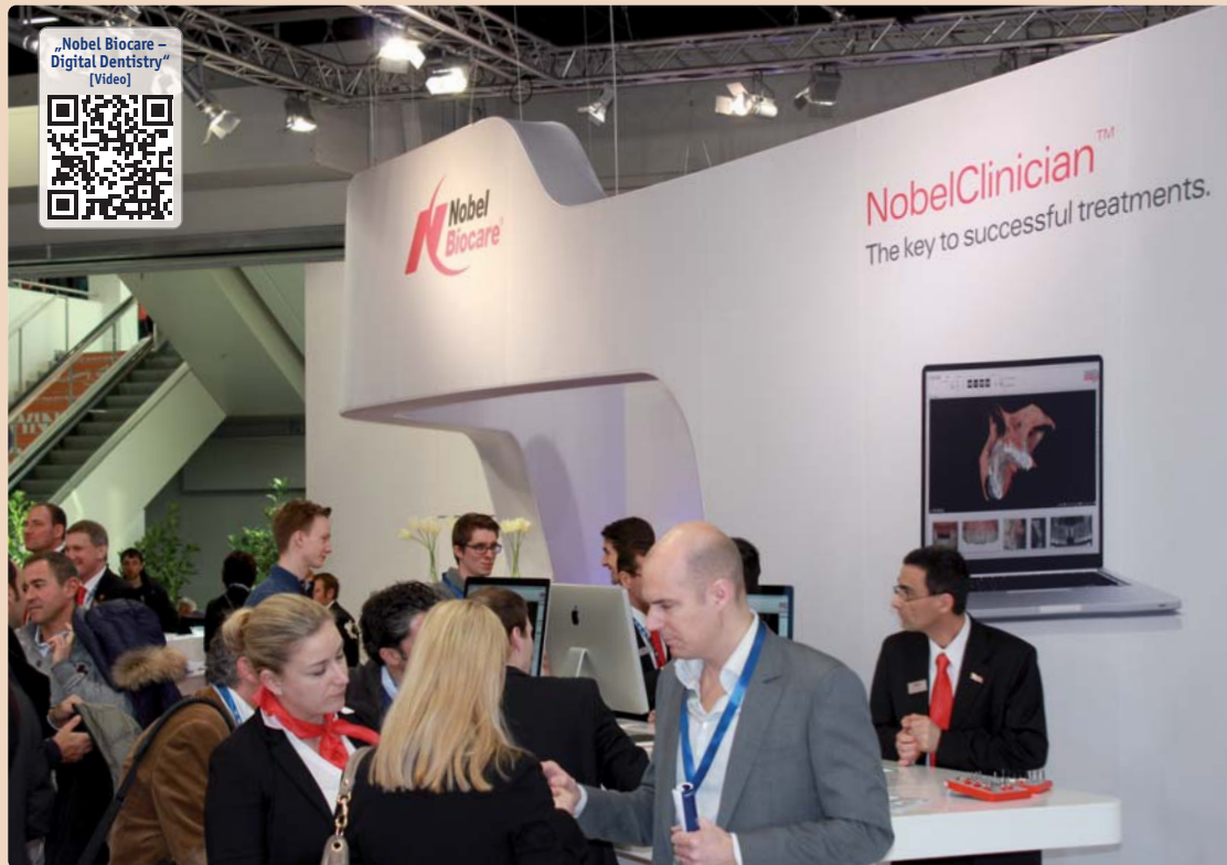
„Wir unterstützen unsere Kunden mit dem eigenen Anspruch, ein erstklassiges Produktangebot und hoch qualifiziertes Mitarbeiter-Team zu bieten.“

Es herrscht zunehmend Unsicherheit, besonders zu Fragen der Haftung und des Medizinproduktegesetzes. Sowohl der Behandler als auch der Patient sollten daher sehr sorgfältig auf langjährige Evidenz, Wissenschaftlichkeit und Erfahrung achten – eben auf den Standard eines globalen