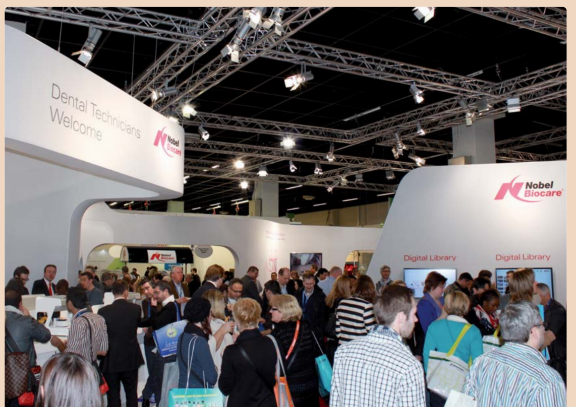
„Unsere Wachstumsstrategie baut auf drei strategischen Pfeilern: Innovative Produkte, Partnerschaft mit unseren Kunden und die Schulung.“