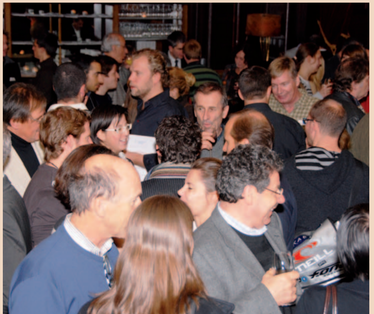
Nach den Vorträgen war der Apéro wohlverdient.