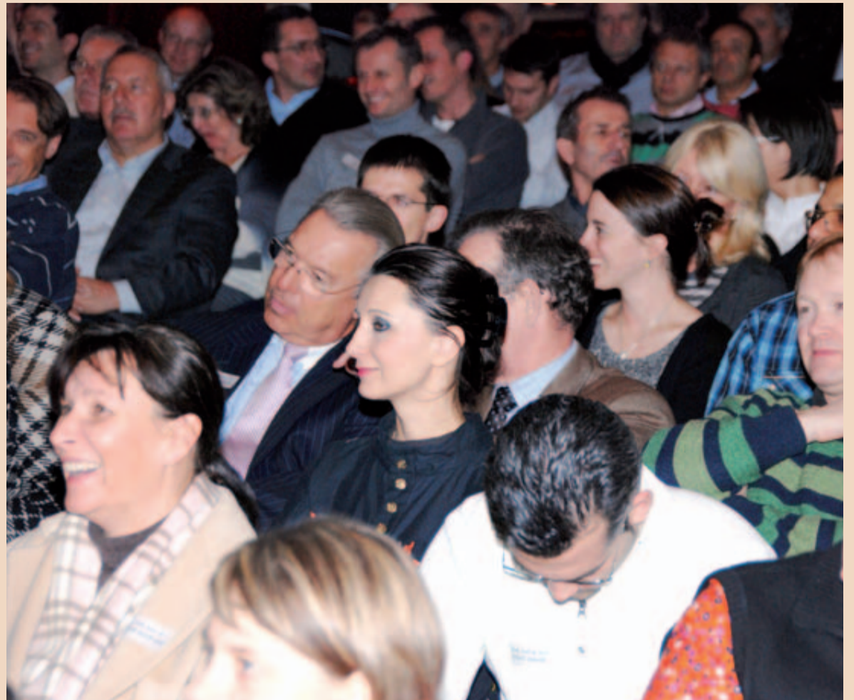
Aufmerksame Zuhörer im Kaufleuten.