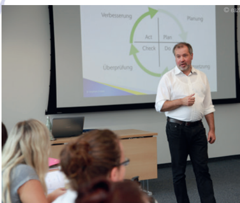
Die Präsenzfortbildung lebt vom persönlichen Kontakt und hat nach wie vor Zukunft.