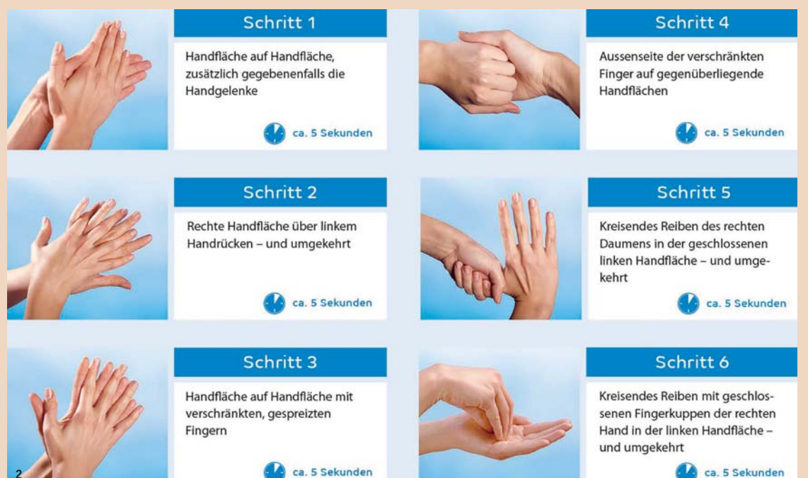
Abb. 2: Sechs Schritte der Händedesinfektion.

Maximale Infektionsprävention hat allerhöchsten Stellenwert, um sowohl Patienten als auch Personal zu schützen. Untersuchungen zeigen, dass Mikroorganismen, wie Staphylococcus aureus (und dessen resistente Variante MRSA), ohne ausreichende Dekontaminationsmassnahmen bis zu mehreren Monaten auf unbelebten Flächen noch nachgewiesen werden konnten. Influenzaviren werden durch Tröpfchen- und Schmierinfektion übertragen. Bakterien und Viren können zum Beispiel über mehrere Tage an Oberflächen und Türgriffen, Treppengeländern oder Ge-