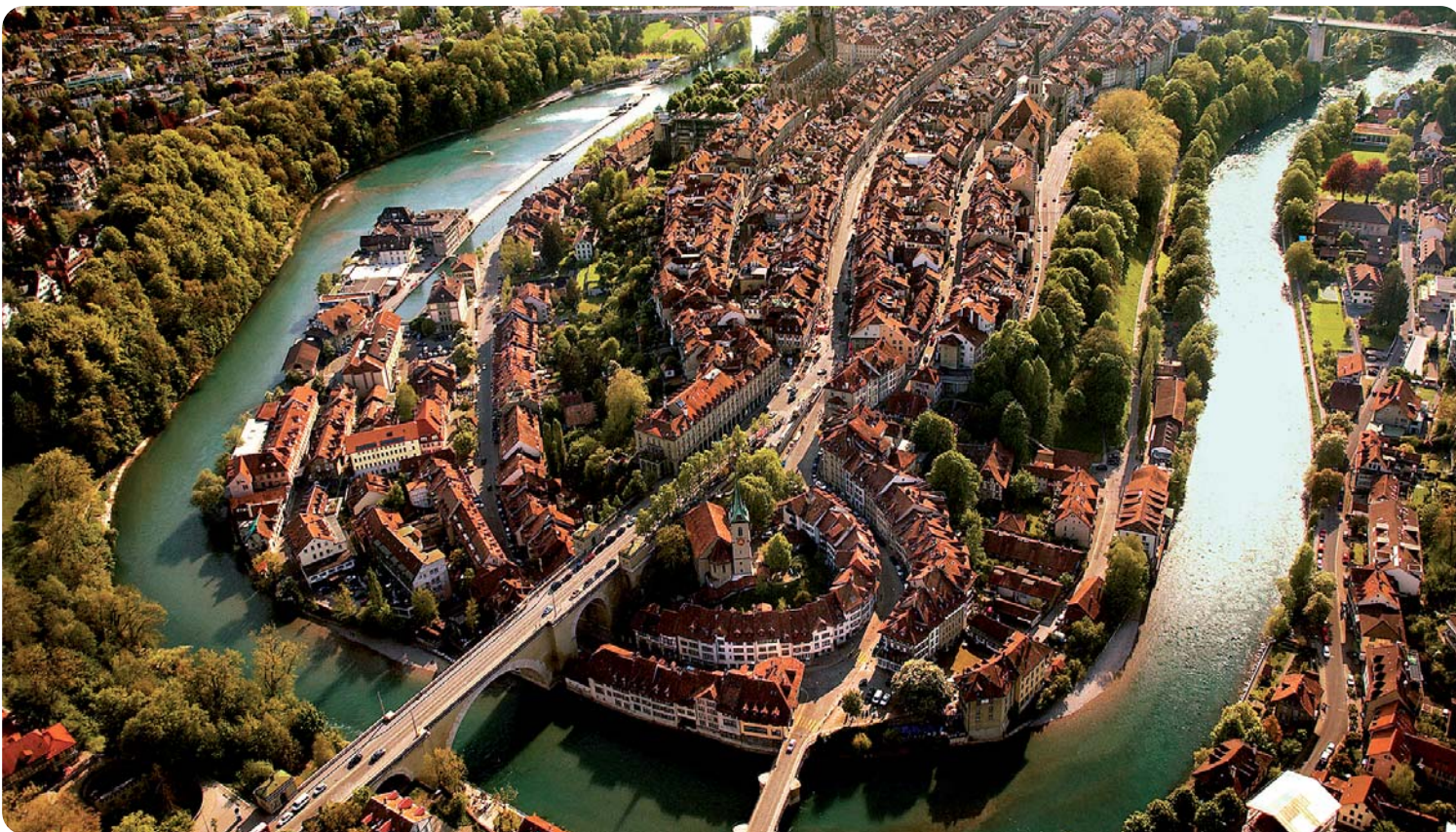
Blick auf die Berner Altstadt, umrahmt von der Aare.

Die Bernexpo wird vom 14. bis 16. Juni zum Treffpunkt für Schweizer Zahnärzte und deren Teams.