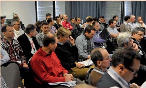
Mit 65 Kieferorthopäden war das Incognito Exchange Forum in Bern sehr gut besucht.