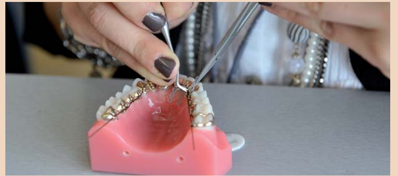
DA bei Hands-on Übungen am Typodonten.