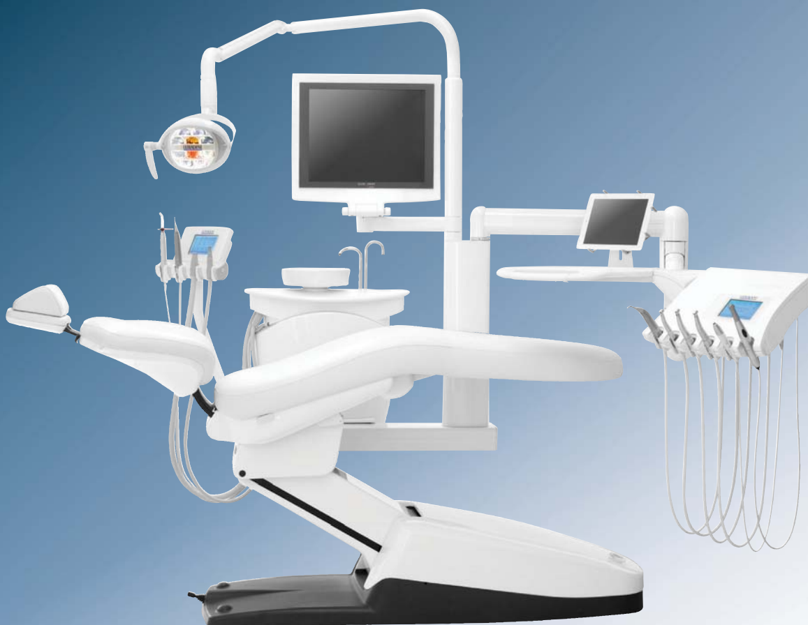
Mod. Ultradent U1500

Die Firma LOMETRAL AG liefert von der Einzelplatz-Lösung bis zur Klinik-einrichtung das gesamte Spektrum.