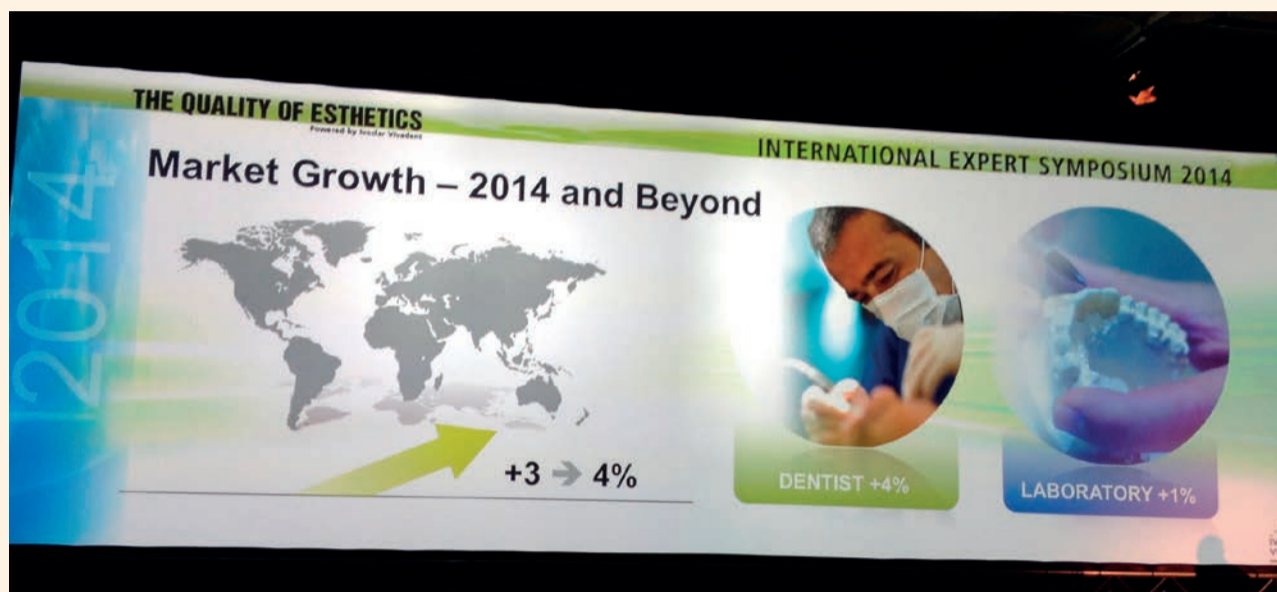
Slide di presentazione del CEO Robert Ganley.