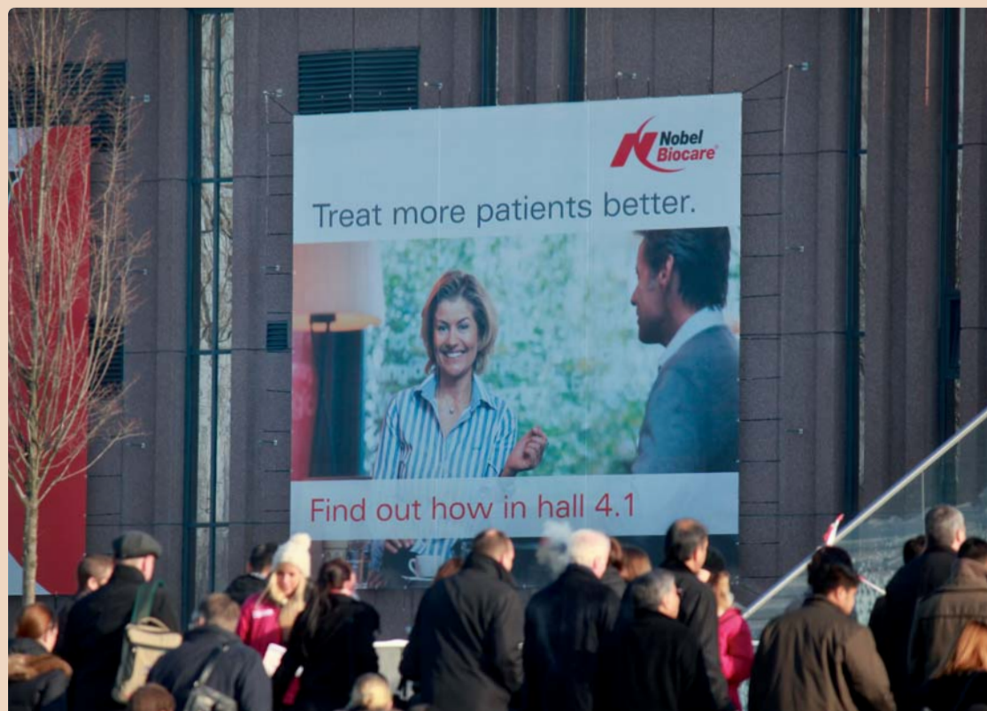
„Wir verfolgen einen gesamtheitlichen Ansatz und möchten den Behandlungsprozess für Arzt und Patient effizienter und angenehmer gestalten.“

Unter der Überschrift „Designing for Life“ hat Nobel Biocare bereits