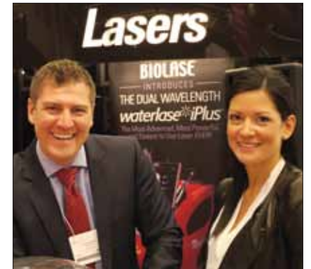
· Assurez-vous de faire l'essai des lasers au kiosque de Biolase (no. 200-202). · Be sure to try out the lasers in the Biolase booth (No. 200-202).