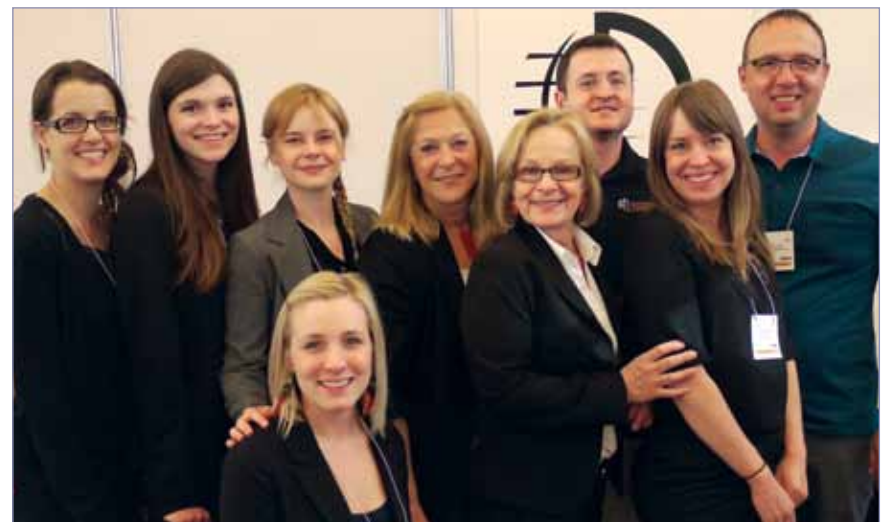
▸ Le personnel des inscriptions aux JDIQ, prêt à vous assister. h. (Photo/Anna Kataoka, Dental Tribune) ▸ The JDIQ registration staff, ready to serve you. (Photo/Anna Kataoka, Dental Tribune)