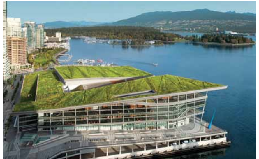
· Le Centre des Congrès de Vancouver, avec son toit 'vert' à haut rendement énergétique nettement visible, accueille le Congrès Dentaire du Pacifique 2014. · The Vancouver Convention Centre, its 'green' roof clearly visible, is host site of the 2014 Pacific Dental Conference.

Des tarifs préférentiels sont disponibles pour les participants au PDC. Nous recommandons de réserver tôt pour vous assurer d'une disponibilité. Les réservations peuvent être faites directement à l'hôtel par l'entremise de l'hyperlien : www.pdconf.com . L'inscription commence le 15 octobre avec des tarifs légèrement pour tous les membres de l'équipe dentaire.