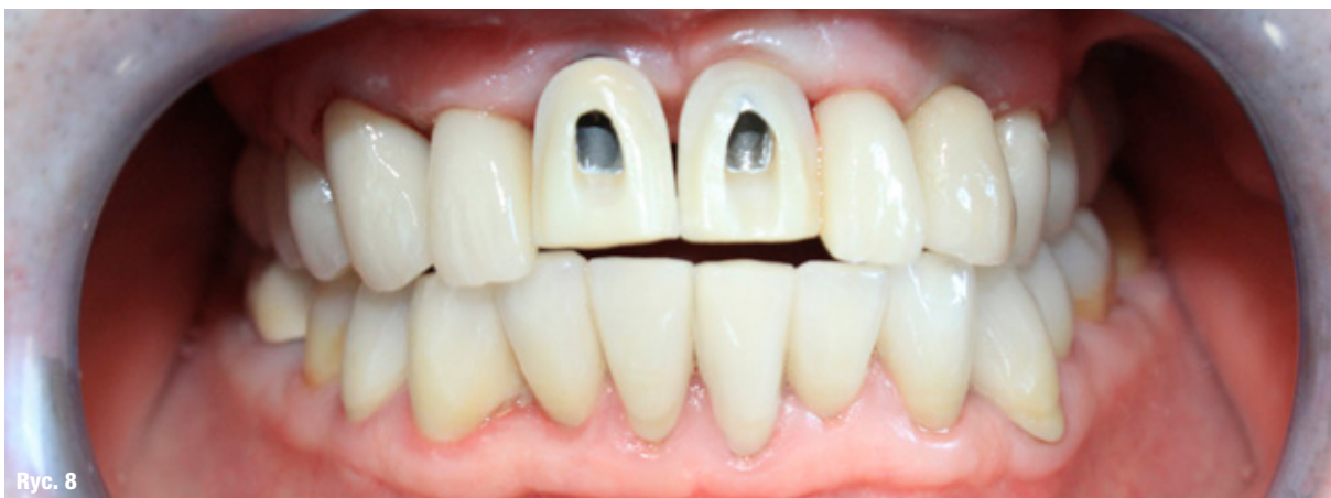
Ryc. 8: Przymiarka koron na implantach w pozycji 11 i 21 bez licówek z widocznymi slotami śrub łączników.

W gabinecie przymierzono korony wraz z licówkami zamykającymi otwory śrub łączników (Ryc. 8-10), a następnie przykręcono korony, używając śrub protetycznych i kluczy dynamometrycznych ze wskazanym przez producenta momentem siły, przykładając siłę przez 5 s. Otwory śrub łącznika wypełniono sterylizowaną taśmą teflonową (PTFE), pozostawiając 2-3 mm przestrzeni w części