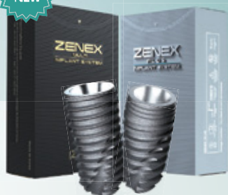
Fixture Line Up