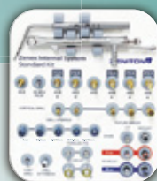
Zenex Standard Kit