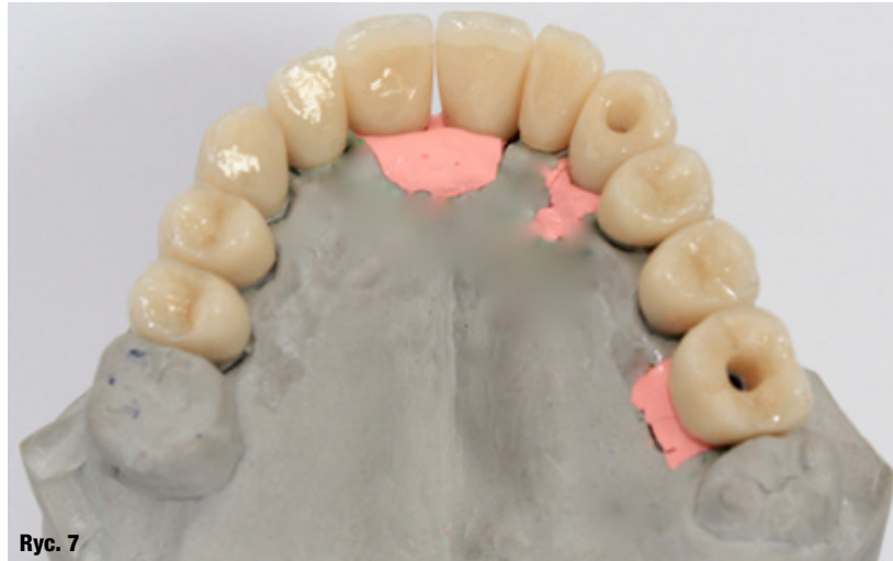
Ryc. 7: Licówki porcelanowe zamykające sloty śrub w koronach na modelu – widok od strony podniebiennej.

Zdecydowano o zastosowaniu niestandardowego rozwiązania, tj. wykonanie koron przykręcanych na podbudowie z tlenku cyrkonu oraz wykonanie licówek