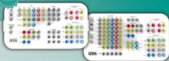
Zenex Surgery Kit