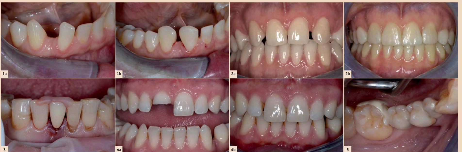
Abb. 1a: Die Patientin stört sich an der grossen Lücke zwischen 43 und 42. Sie wünscht eine Lückenverkleinerung, hat aber nur eingeschränkte finanzielle Möglichkeiten. – Abb. 1b: Additive Zahnverbreiterung mit Komposit bei 43 mesial und 42 distal. – Abb. 2a: Junge Patientin (<30 Jahre) mit Nichtanlagen von 12 und 22. Wünscht ästhetische Verbesserung in relativ kurzer Zeit, da Auslandsaufenthalt ansteht (keine Kieferorthopädie und Implantation möglich). – Abb. 2b: Additive Zahnverbreiterung mit Komposit und Umgestaltung der Eckzähne zu seitlichen Schneidezähnen sowie der ersten Prämolaren zu Eckzähnen. – Abb. 3: Positionierschlüssel aus Kunststoff für 41, welcher nach Exzision mittels glasfaserverstärktem Komposit an den Nachbarzähnen befestigt werden soll. Genau gleich können auch Positionierschlüssel für Fragmente hergestellt werden. – Abb. 4a: Der Patient hat ein Frontzahntrauma (Kronenfraktur ohne Pulpabeteiligung) bei Zahn 11 erlitten. – Abb. 4b: Das Reattachment konnte dank des aufgefundenen Fragmentes sehr gut durchgeführt werden. Die „Restauration“ ist nahezu unsichtbar. – Abb. 5: Zirkoninlaybrücke von alio loco. Der linguale Adhäsivflügel ist lose. Zudem ist die Gerüstgestaltung lingual bis weit zum Margo gingivae geführt, sodass es zu einer chronischen Entzündung der Gingiva kommt.

Je nach Situation kann das Kompositmaterial frei Hand geschichtet werden (Abb. 1a und b), oder man kann sich mithilfe der Formgestaltung erleichtern. Die Vorteile der rein additiven Formveränderung liegen auf der Hand: Die Veränderung ist reversibel und kann bei Nichtgefallen jederzeit geändert werden. Kommt es zu einem allfälligen Misserfolg, kann die Restauration einfach repariert werden. Gerade bei umfassenden Formveränderungen von Zähnen (z.B. bei Nichtanlagen) kann es sinnvoll sein, zunächst die Zähne mit Komposit zu versorgen und die Situation einige Jahre zu belassen, bevor dann später mit Keramikschalen die Zähne „definitiv“ versorgt werden (Abb. 2a und b). Mit diesem Vorgehen kann sich der Patient an das neue „Lächeln“ gewöhnen, und die Kompositfüllungen dienen als Vorlage für die definitive Gestaltung der Keramikarbeiten. ➔