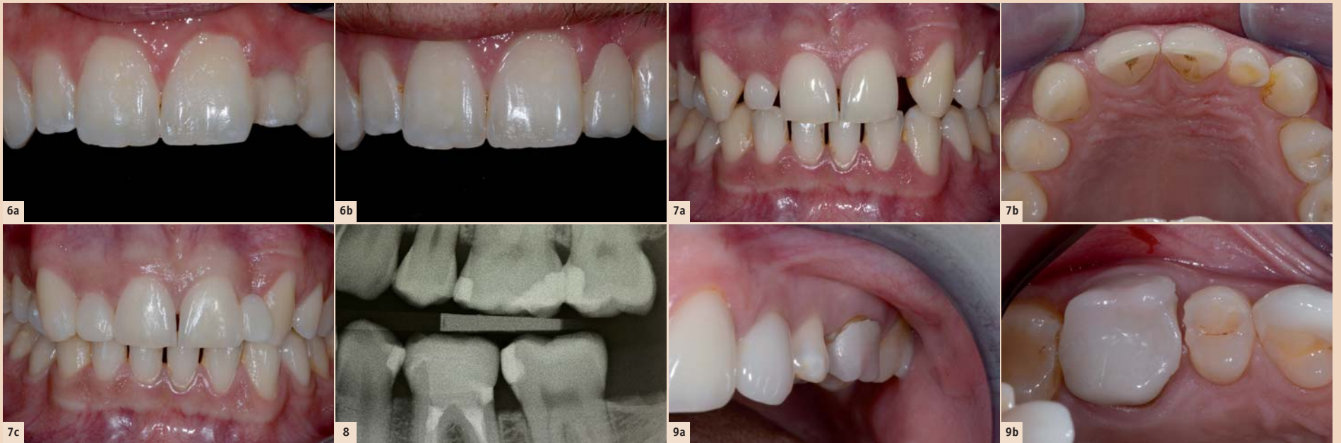
Abb. 6a: Marylandbrücke für 22 von alio loco. Der Zahnersatz wirkt zu kurz und es kommt immer wieder zu Dezentrierungen der beiden Adhäsivflügel. – Abb. 6b: Die neue vollkeramische Klebebrücke ist nur noch einflügelig an 21 befestigt. Die Ästhetik ist auf Sprechdistanz sehr ansprechend. – Abb. 7a: Der Patient hat Nichtanlagen der seitlichen Schneidezähne. Dabei ist Milchzahn 52 in situ, während 62 nicht vorhanden ist. Der Patient ist in der Ausbildung und hat nur wenig finanzielle Mittel zur Verfügung. Eine kieferorthopädische Behandlung oder eine teure Sanierung kann sich der Patient nicht leisten. – Abb. 7b: Die asymmetrische Lückenverteilung und vor allem das enge Platzangebot bei der Lücke Regio 22 ist in der Palatinalansicht besonders deutlich. – Abb. 7c: Die Situation wurde so gelöst, dass 11 und 21 additiv nach distal und 13 nach mesial verbreitert wurden. Auch 52 wurde rein additiv verbreitert und verlängert. In Regio 22 wurde eine direkte faserverstärkte Kompositbrücke gemacht mit Attachment palatinal 21. Problematisch war das sehr enge Platzangebot, weshalb Zahn 22 nach distal aussen rotiert modelliert werden musste. Sicherlich ist es ästhetisch nicht perfekt gelöst, aber die Situation ist für den Patienten zurzeit zufriedenstellend. Grosser Vorteil der Behandlung ist, dass die ganze Versorgung rein additiv erfolgte und nichts präpariert wurde. Der Termin für die Dentalhygiene war noch ausstehend! – Abb. 8: Röntgenbild einer CEREC-Endkrone bei 36 aus Keramik. Deutlich zeichnet sich die PBE distal ab. Die Situation ist seit 6 Jahren stabil. Erkennbar ist das Knochenremodelling: Das Knocheniveau von 36 ist distal niedriger als mesial. – Abb. 9a: Die CEREC-Krone 26 wurde alio loco vor ca. 8 Monaten inseriert. Der deutlich abstehende Kronenrand sowie die suboptimale Oberflächenstruktur der Restauration fallen auf. – Abb. 9b: Die Okklusalanansicht bestätigt den Eindruck von vestibulär (Abb. 9a). Die CEREC-Krone weist nach mesial einen insuffizienten Kontaktpunkt auf. Zudem sind die Präparationsdefekte distal von 25 und mesial von 27 deutlich erkennbar. In diesem Fall musste die ganze Restauration entfernt und neu angefertigt werden. Zusätzlich mussten aufgrund der Präparationsdefekte Kompositfüllungen bei den Nachbarzähnen gelegt werden.