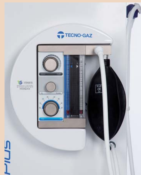
Lachgasgerät (ohne Zubehör).

Was sagen Ihre Patienten nach den Eingriffen unter Sedierung?