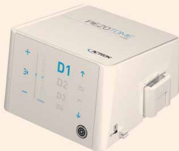
Compacto y potente, Piezotome CUBE es el motor quirúrgico ultrasónico más avanzado del mercado.

El generador de energía ultrasónica uti-