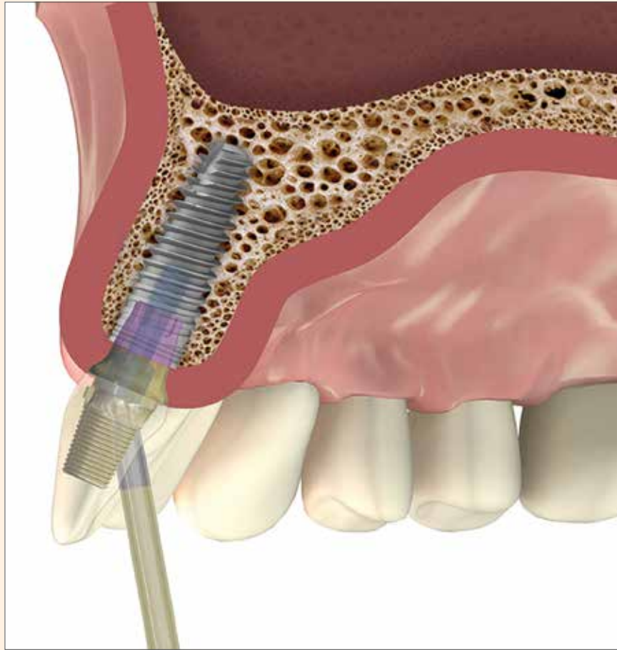
Simulación del ángulo de colocación que permite el pilar EZ-Base de MIS.

El destornillador EZ-Base ofrece una punta única que permite un acceso seguro y confiable desde múltiples ángulos, así como el ajuste dentro del canal de