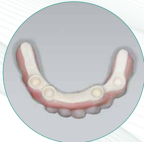
Prótesis Fijas Adheridas a Barra Libre de Metal Trinia