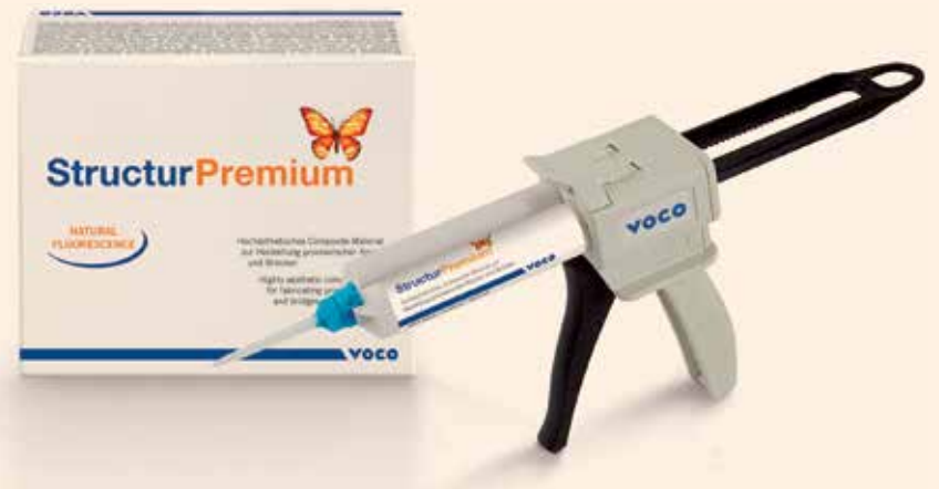
El material provisional Structur Premium es ideal para coronas y puentes estéticos.

El material está disponible en siete colores (A1, A2, A3, A3.5, B1, B3, BL) y todas las gamas de color tiene una fluorescencia natural y ofrecen un alto brillo de los provisionales en todas las condiciones de luz. Dado que la baja absorción de agua de Structur Premium, los provisionales quedan du-