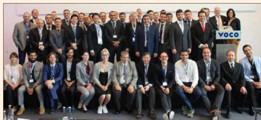
Cuarenta odontólogos participaron en el International Fellowship Symposium organizado por VOCO.