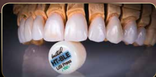
Restauraciones: Cortesía de Bill Marais, RDT & Rick Canizares, DMD

G-CEM LinkForce™ cemento de resina optimizado para ser utilizado con GC Initial™ LiSi Press