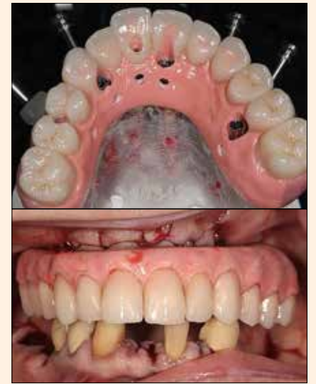
Figura 2. Las restauraciones de bloques/discos HC son perfectas para reemplazar porcelana feldspática y disilicato de litio, y más fácil, rápidas y económicas de fabricar.

La microarquitectura única de los bloques y discos HC soporta una