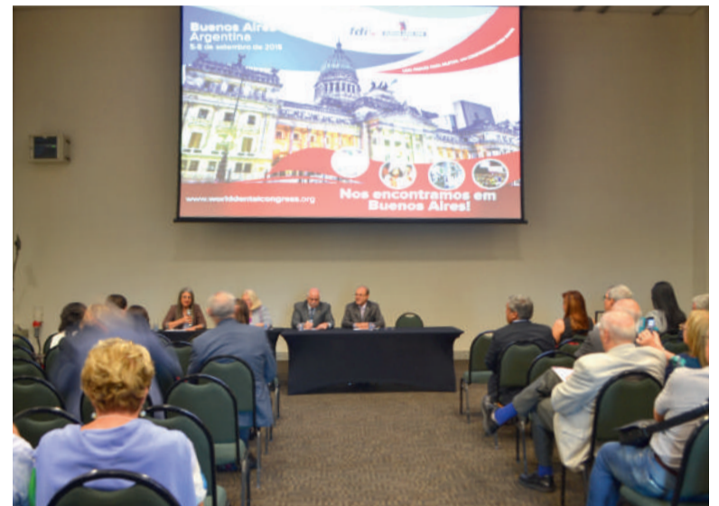
*O CIOSP dedicou dois dias exclusivos para discutir a Odontologia no âmbito da América Latina e em 2019 a proposta é ampliar essa discussão.