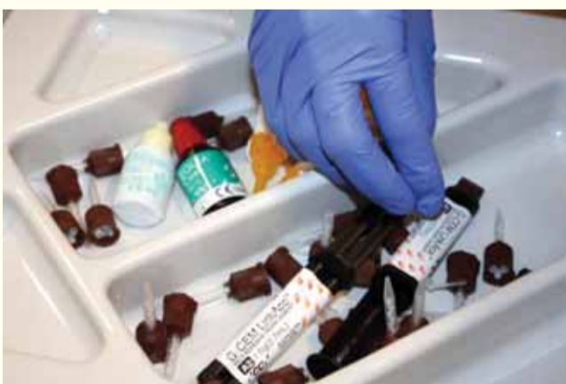
Slika 1: G-CEM LinkAce šprice ne treba čuvati u hladnjaku.

„G-CEM LinkAce držim u ladici, uvijek spremnog za upotrebu.“