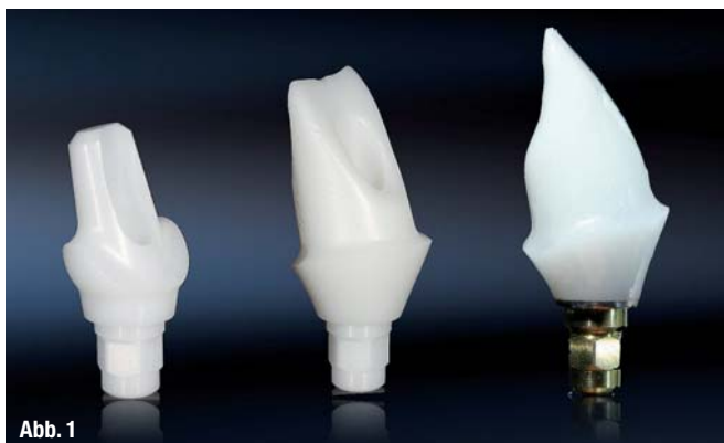
Abb. 1 Varianten von Zirkon-Implantataufbauten von links nach rechts: Konfektioniert einteilig (CERCON®); CAD/CAM einteilig und CAD/CAM zweiteilig/Titan-Klebbasis (Compartis®). Abb. 2 Computer-aided design und fertig verklebtes, zweiteiliges CAD/CAM Zirkonabutment auf Titan-Klebbasis.