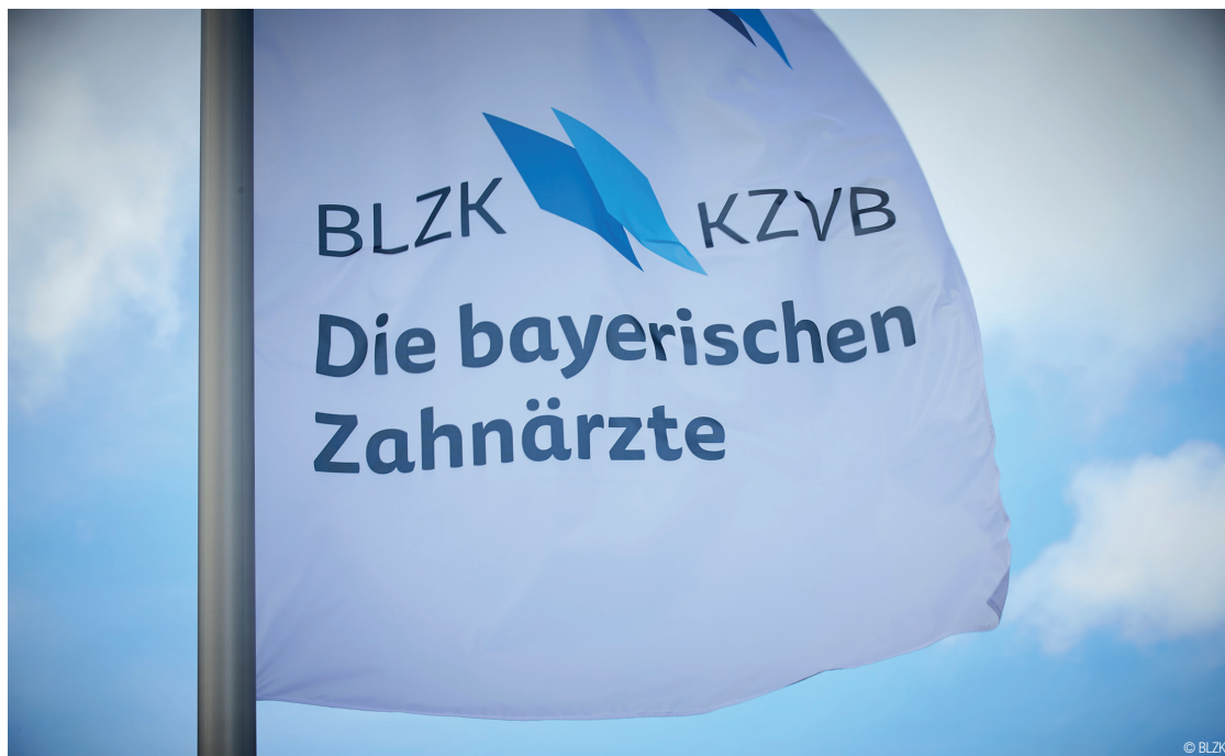
Unter gemeinsamer Flagge beim Bayerischen Zahnärztetag.