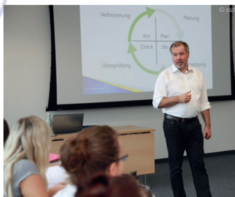
Die Präsenzfortbildung lebt vom persönlichen Kontakt und hat nach wie vor Zukunft.