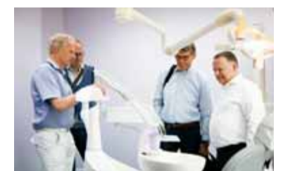
Verhagen Volledig Mondzorg was één van de acht genomineerden in de vorige editie.

Inschrijven of meer weten over deze verkiezing? Kijk dan op www.tandartspraktijkvanhetjaar.nl . ■