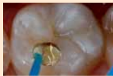
Фиг. 14. Поставяне на повърхностния продукт за блясък Natural Glaze (Nova DFL).