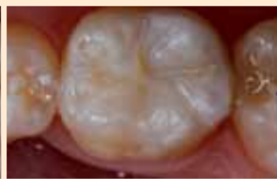
Фиг. 13. Вид след полиране и финиране.