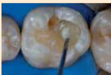
Фиг. 4. Подложка от глас-йонномерен цимент (Nova DFL).