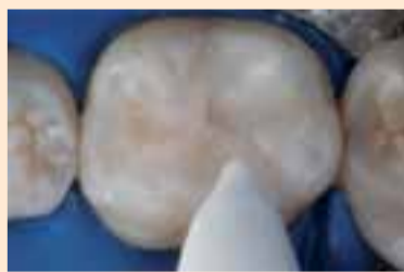
Фиг. 12. Финиране с гумички Nova DFL.