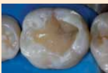
Фиг. 7. Поставяне на слоеве фотополимер Natural Look (Nova DFL).