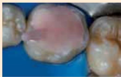
Фиг. 11. Матрицата вече е поставена и притисната, готова за фотополимеризиране.