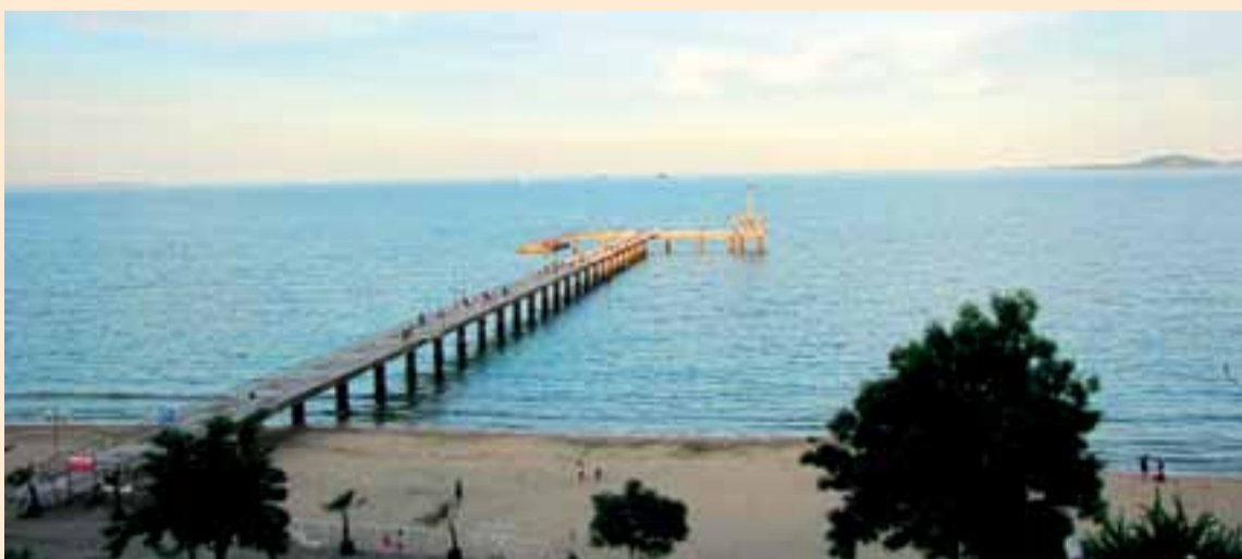
По традиция най-голямото събитие на БЗС се провежда в Бургас

За поредна година Българският зъболекарски съюз организира своето най-голямо научно събитие – станалия вече традиция конгрес, който този път