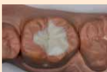
Фиг. 2. Восъчният модел е готов.