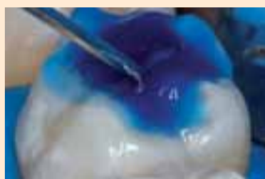
Фиг. 5. Кондициониране с Alpha Etch (Nova DFL) за 15 секунди.