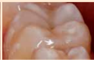
Фиг. 17. Краен резултат, поглед от медиално.