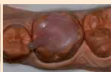
Фиг. 3. Матрица от течен композит Natural Flow (Nova DFL).