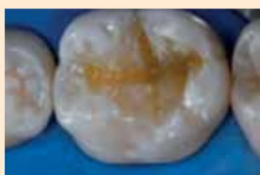
Фиг. 8. Поставяне на оцветителите.