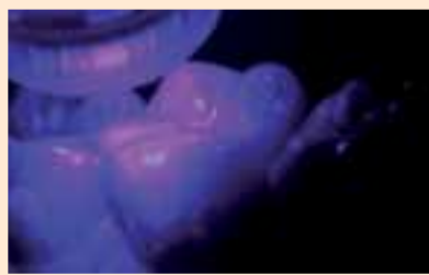
Фиг. 15. Фотополимеризация на повърхностния слой.