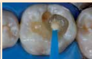
Фиг. 6. Поставяне на адхезив Natural Bond DE (Nova DFL).