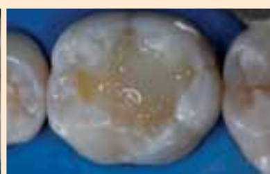
Фиг. 9. Последен слой с прозрачния композит Natural Look (Nova DFL).