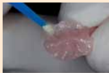
Фиг. 10. Изолиране на оклузалната матрица.