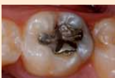
Фиг. 1. Начално състояние.

След фотополимеризирането (фиг. 15) получихме задоволителен естетичен и функционален резултат (фиг. 16 и 17). DT