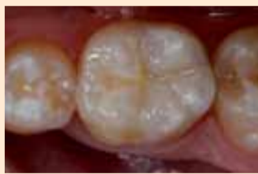
Фиг. 16. Краен резултат, поглед от оклузално.