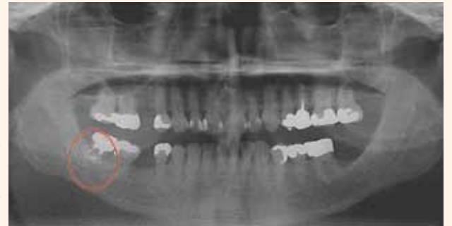
durs de la cavité buccale. Fig. 1: Incidental foreign bodies revealed, most likely amalgam, embedded in the soft and/or hard tissue of the oral cavity caused iatrogenically by a dentist.

Fig. 1: Corps étrangers occasionnels révélés, causés par le dentiste de façon iatrogénique, certainement de l'amalgame incrusté dans les tissus mous et/ou dans les tissus