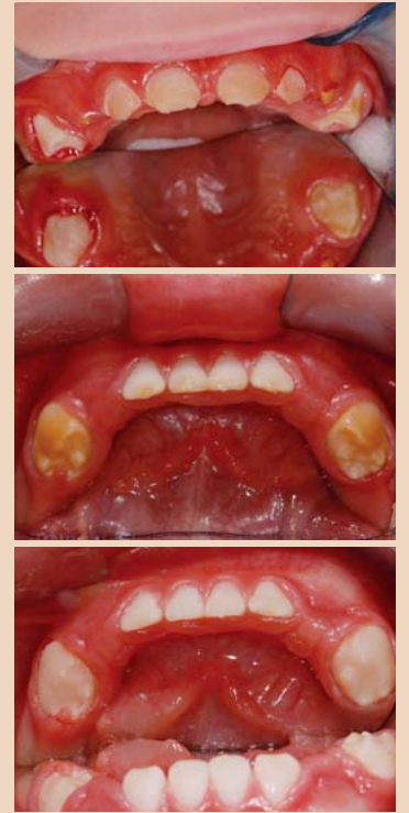
Gebiss mit stark sichtbaren Mineralisationsstörungen durch Kohlschütter-Tönz-Syndrom.