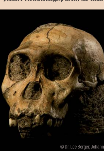
Schädel eines männlichen Australopithecus sediba, der 2008 in der Malapa-Ausgrabungsstätte in Südafrika entdeckt wurde.