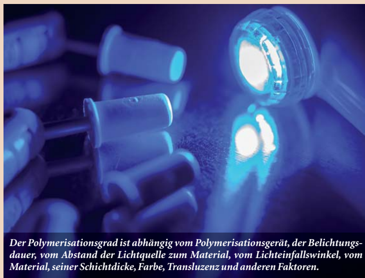
Der Polymerisationsgrad ist abhängig vom Polymerisationsgerät, der Belichtungsdauer, vom Abstand der Lichtquelle zum Material, vom Lichteinfallswinkel, vom Material, seiner Schichtdicke, Farbe, Transluzenz und anderen Faktoren.

Je nach individueller Prädisposition und Immunstatus können Komposite anscheinend zu sehr unterschiedlichen Symptomatiken beitragen bzw. führen – ähnlich einer Virusinfektion, auf die verschiedene Menschen ebenfalls mit sehr unterschiedlichen Symptomen und Verläufen reagieren können. Im Gegensatz zur Virusinfektion, die wir unter Umständen sehr adäquat z.B. durch Fieber selbst erfolgreich therapieren können, verursacht das dauerhaft inkorporierte Komposit permanenten, untherapierbaren Stress an derselben Stelle im Organismus – meist über Jahrzehnte.