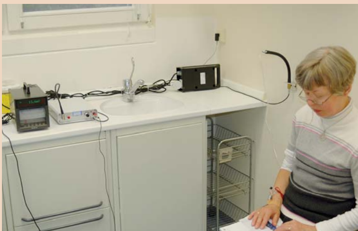
Probandin bei der Messung.

muss. Daher sind die Versuche schon aufwendig und die Messungen müssen unter strenger Aufsicht erfolgen.“ Deshalb vergibt Toothfriendly International, Basel, die gemeinnützige und nicht gewinnorientierte Dachorganisation der Berliner Aktion zahnfreundlich e.V., die Zulassung der Messstationen auch nur nach wissenschaftlich exakt festgelegten