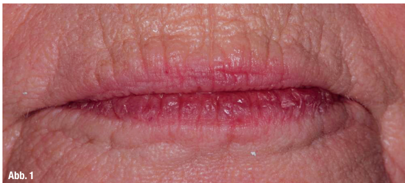
Abb. 1–3: Zustand der Patientin bei der Eingangsuntersuchung mit dem Wunsch einer ästhetischen Korrektur der Oberkieferfront. Bereits jetzt wird die Vielzahl von nötigen Behandlungsschritten deutlich.

In der Praxis stellen die Patienten 60 plus zum Teil eine große Herausforderung dar. Nicht wenige haben bereits multiple Versorgungen von unzähligen Zahnärzten erhalten, die zum Teil deutlich in die Jahre gekommen sind. Diese Versorgungen sind in der Regel schwierig, da sie zum einen unterschiedlich alt sind, zum anderen aber auch Systeme zum Einsatz gekommen sind, die man heute so nicht mehr kennt. Häufig ist die Bisslage weit vom Ursprung entfernt und die Patienten stören sich – anders als in den letzten Jahren – vermehrt an ihrem Aussehen. Mehr denn je ist bei dieser Altersgruppe zu spüren, dass der Druck nach gesundem und jungem Aussehen auch in dieser Generation angekommen sein muss.